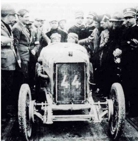
1926 Targa Florio